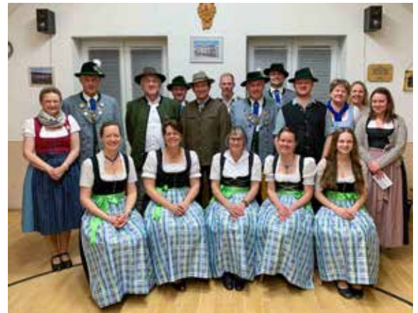
Die neue Vorstandschaft.