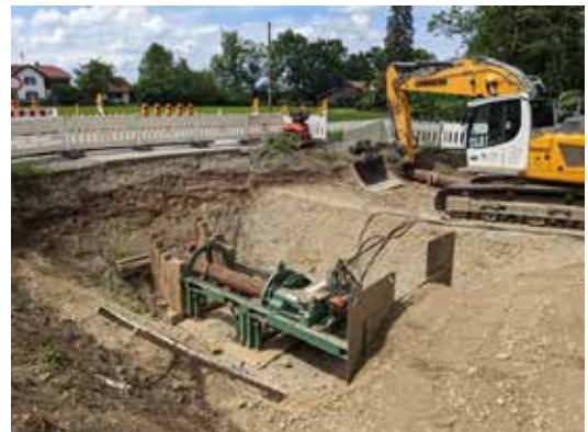
Pressung unter der Staatsstraße 2054

Bei Ramsach wurde ein Übergabeschacht errichtet. Ein weiterer Wasserzählerschacht wurde südlich von Schwabhausen gebaut. Der Anschluss an das Pumpenhaus Schwabhausen wurde fertiggestellt.