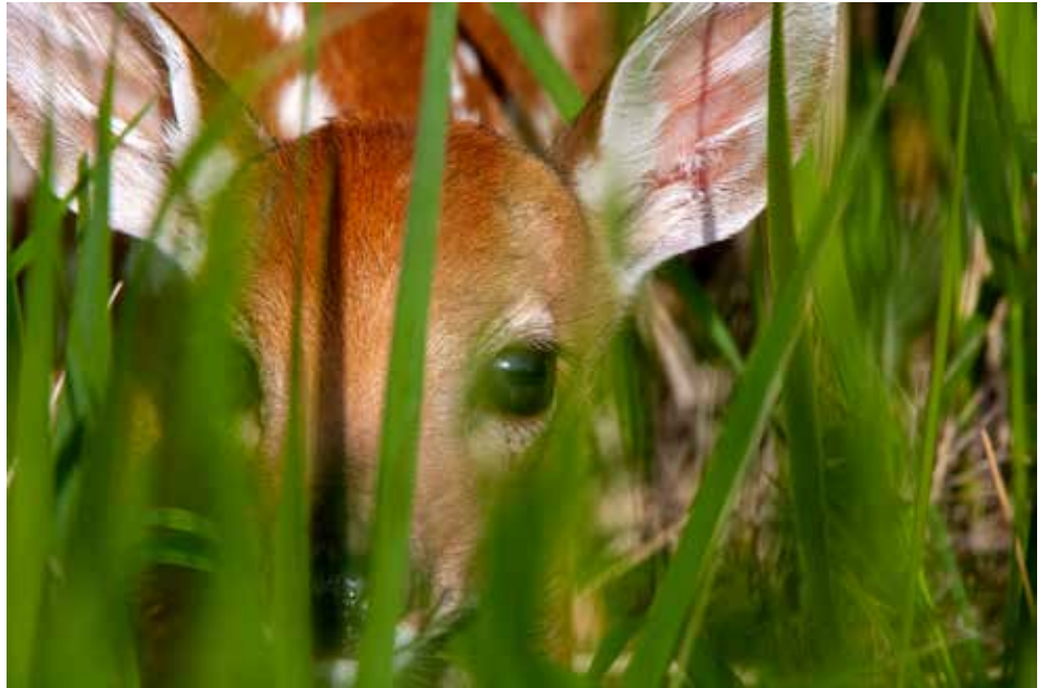
Rehkitze liegen oft gut getarnt in Wiesen. Daher ist es wichtig, dass die Hunde an die Leine genommen werden und somit ein Stöbern in den Felder unterbunden wird.

Deshalb appellieren wir an alle Naturfreunde, Spaziergänger und vor allem Hundebesitzer, sich rücksichtsvoll zu verhalten. Bitte bleibt auf den Wegen und vermeidet es, querfeldein zu laufen, denn viele Jungtiere sind gut getarnt und kaum sichtbar. Hunde sollten in dieser Zeit unbedingt an der Leine geführt werden, da selbst der gehorsamste Hund seinem Jagdinstinkt folgt, wenn er eine frische Fährte aufnimmt. Auch Lärm kann Wildtiere stressen und sie dazu bringen, ihre Jungen zurückzulassen. Daher bitten wir darum,