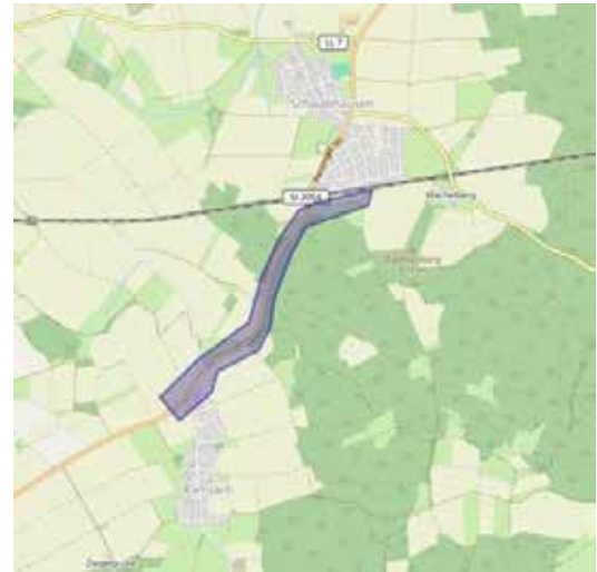
Visualisierung des Gebietes der Baustelle

Somit ist eine wichtige Einbindung in das Verbandsnetz der Pörringer Gruppe erfolgt. Dieses Projekt war ein wichtiger Schritt, um die Sanierung des Wassernetzes und die Versorgungssicherheit der Pörringer Gruppe in den kommenden Jahren voranzutreiben.