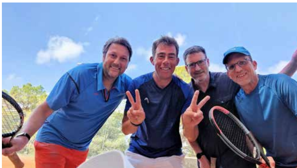
Trainingsschweiß als Basis für eine erfolgreiche Saison 2023

Herren, Südliga 1 Sonntag, 7. Mai, 9 Uhr: TSV Haunstetten – TC Pürgen Sonntag, 14. Mai, 9 Uhr: