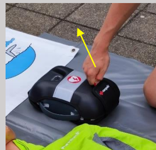
Schritt 3: Öffnen der Gerätehülle (rote Lasche, in Pfeilrichtung aufklappen)