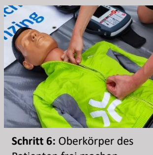
Schritt 6: Oberkörper des Patienten frei machen (Patient liegt dabei idealerweise auf einer flachen und harten Unterlage)