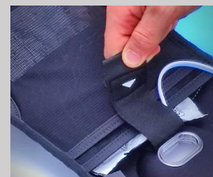
Schritt 7: Elektrodenfach im Deckel der Hülle öffnen