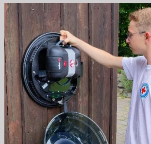
Schritt 2: Entnehmen des AED-Geräts