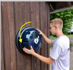
Schritt 1: Abnehmen des Gehäusedeckels (Drehung in Pfeilrichtung gegen den Uhrzeigersinn)