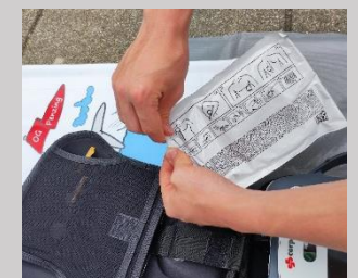
Schritt 8: Elektrodenverpackung entnehmen, an Einkerbung aufreißen und Elektroden herausnehmen