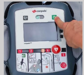
Schritt 4: Einschalten des Gerätes (Grüner Knopf) – ab hier beginnt das Gerät, Sie mit Anweisungen zu unterstützen