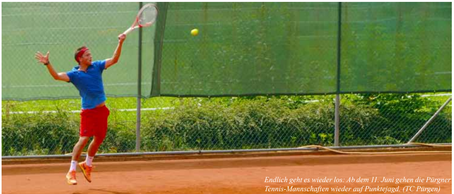
Endlich geht es wieder los: Ab dem 11. Juni gehen die Pürgner Tennis-Mannschaften wieder auf Punktejagd. (TC Pürgen)