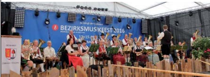
Leitung: Andreas Kößler

des MON Bezirk Lech-Ammersee am Sonntag, 22. April 2018 ab 10.00 Uhr in der Mehrzweckhalle in Lengenfeld