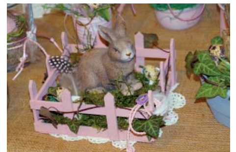
Osterhasen-Gesteck von Hilde Haller