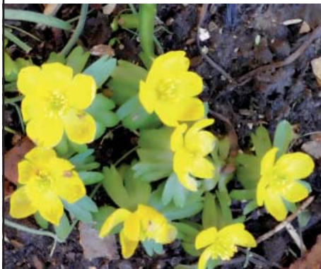
Naturfotos von Walter Herzog