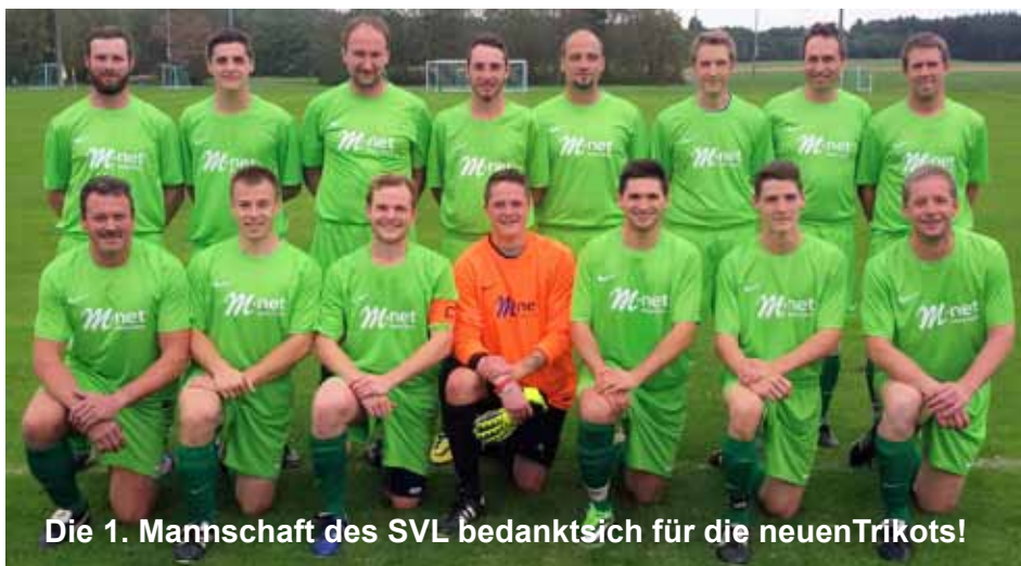
Die 1. Mannschaft des SVL bedankt sich für die neuen Trikots!