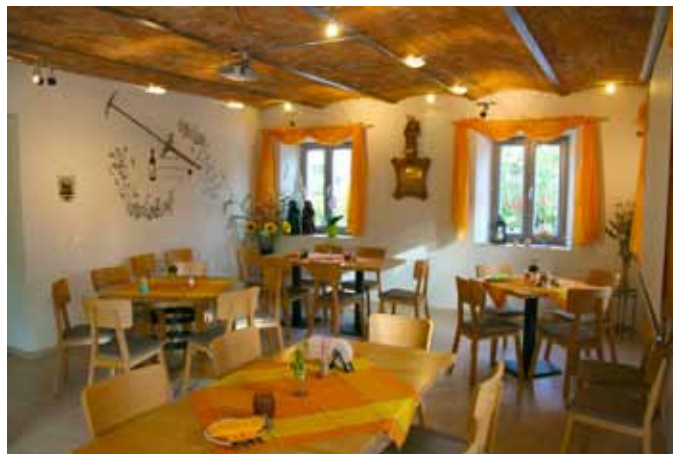
Impressionen Bürgerheim Ummendorf