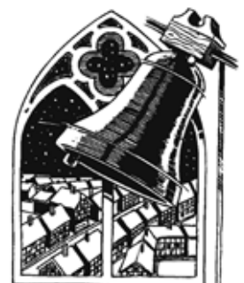
Jahresabschlussandacht Meine Zeit ist in Gottes Händen: Alles Wa- rum, Wann, Wo und Wozu meines Lebens.